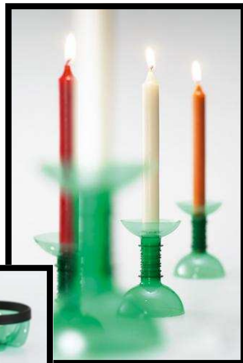
Otra modalidad de portavelas

Portavelas: Necesitas: - Dos botellas de plástico (las mismas del monedero). - Pegamento (Que sirva para pegar sobre plástico) - Tijera.