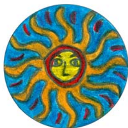
Diseño ganador de Ed. Primaria