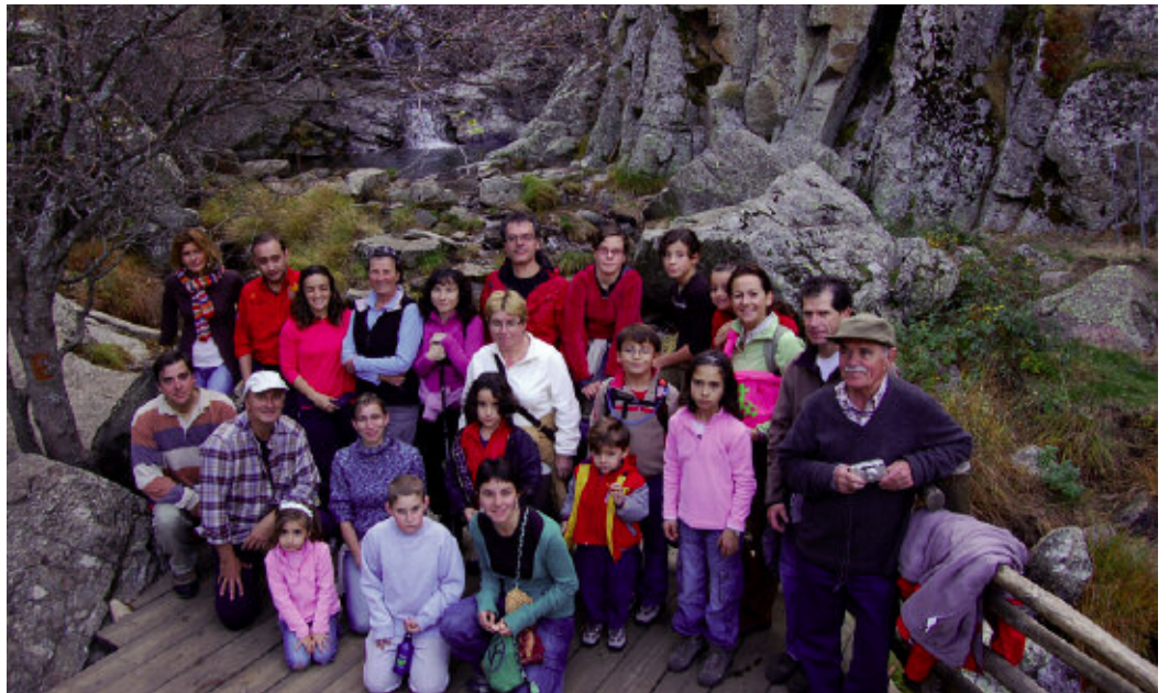
Familiares de alumnos realizaron con ellos recientemente la senda de la Cascada del Purgatorio.